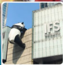
แพนด้ายักษ์ปิ่นตึกIFS