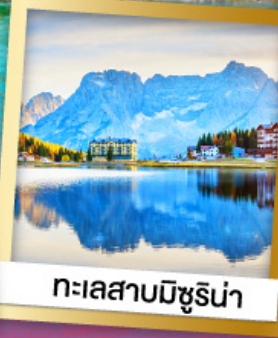
ทะเลสาบมิซูรีน่า