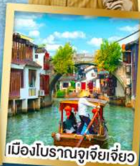
เมืองโบราณจูเจียเจี้ยว