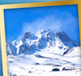
ภูเขาไฟเออซีเยส์