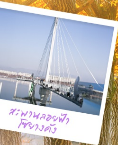
สะพานลอยฟ้า โซฮางดง