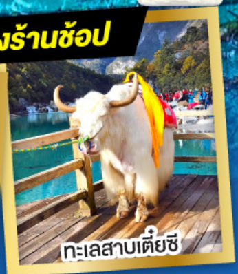
ทะเลสาบเต๋ยซี