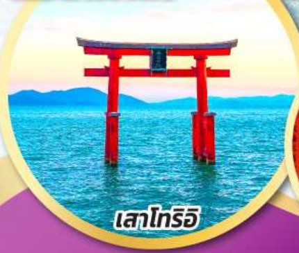
เสาโทริอิ