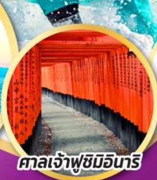
ศาลเจ้าฟูชิมิอนาริ