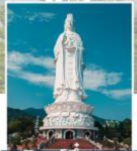
ลินห์อิ่ง