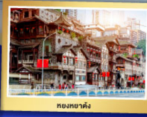
หยงหยาดัง