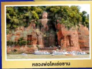
หลวงพ่อโตเล่อซาน