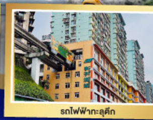
รถไฟฟ้าลูตึก