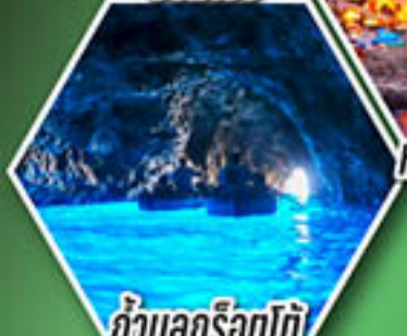
ถ้ำลูกรोटโต้