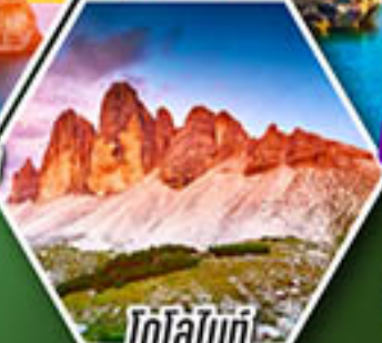
โดโลไมท์

โปรแกรมเดียว เก็บครบจบ อิตาลี ตั้งแต่เหนือถึงใต้