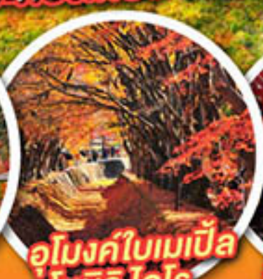
อุโมงค์ใบเมเปิ้ล โมมิจิ โคโร