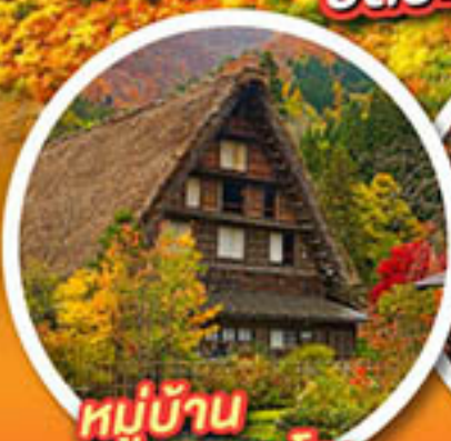
หมู่บ้าน ชิราคาวาโกะ