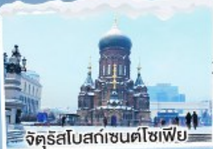
จัตุรัสโบสถ์เซ็นต์โซเฟีย