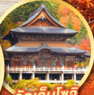
วัดเอ็นโซจิ

กิจกรรมเก็บผลไม้ พักออนเซ็น 2 คืน พักโรงแรมในโตเกียว 2 คืน