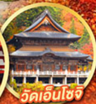
วัดเอ็นโซจิ

กิจกรรมเก็บผลไม้ พักออนเซ็น 2 คืน พักโรงแรมในโตเกียว 2 คืน