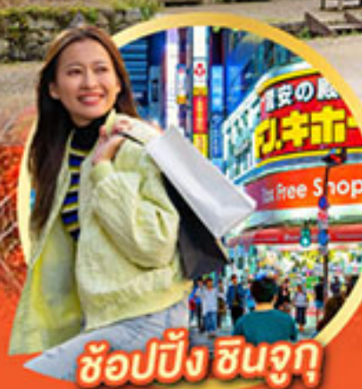
ช้อปปิ้ง ซินจูกุ

นั่งกระเช้าชมวิว ใบไม้เปลี่ยนสี Mt.Adatara