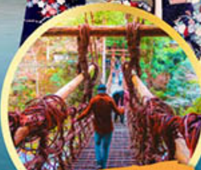
สะพาน อียะโนคะชิระบะชิ