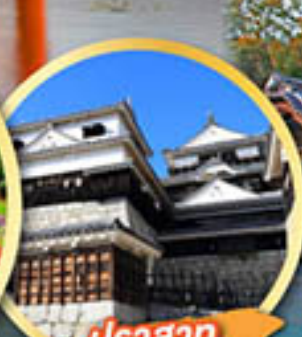
ปราสาท มัตสึยาม่า