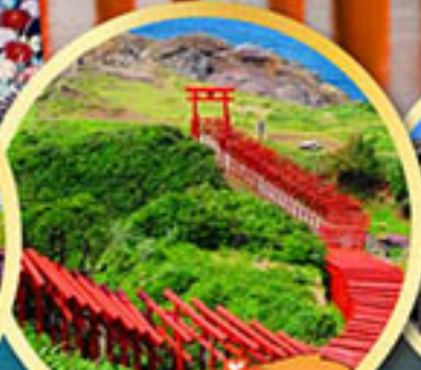
ศาลเจ้า ไมโดโนะซุมิ อินาริ