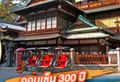
ออนเซ็น 300 ปี โดโจ-ออนเซ็น