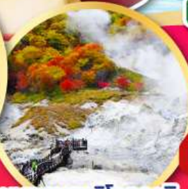
หุบเขานรกจิทอกุดานิ