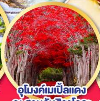
อุโมงค์ไม้แป้นแดง ณ สวนลับฮิราโอกะ