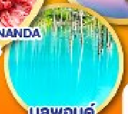
บลูพอนด์ (บ่อน้ำสีฟ้า)