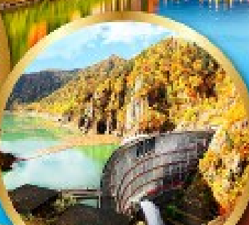
เขื่อนไฮเฮเคียว