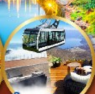
นังกระเช้าอุซซัง

พิเศษ!! บุฟเฟ่ต์ร้าน NANDA ดีที่สุดในซัปโปโร