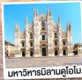
มหาวิหารมิลานดูโอโม