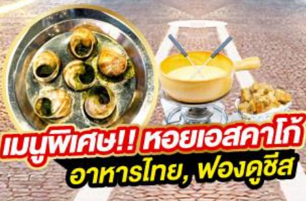
เมนูพิเศษ!! หอยเอสคาโก้ อาหารไทย, ฟองดูชีส