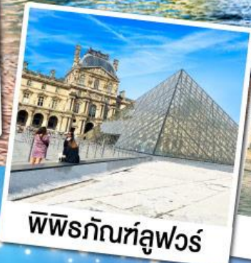
พิพิธภัณฑ์ลูฟวร์