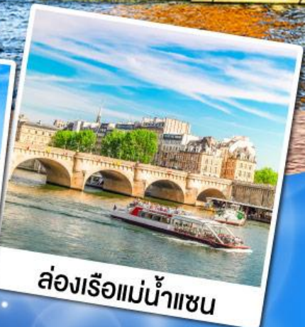
ล่องเรือแม่น้ำแซน

23-29 ก.ย. 67 07-13, 21-27 ต.ค. 67 04-10, 18-24 พ.ย. 67 02-08 ธ.ค. 67