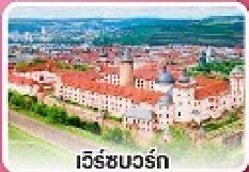
เวิร์ชบวร์ค