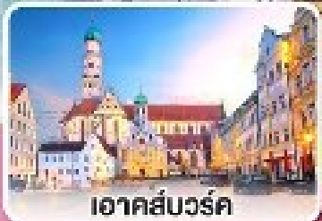
เอาคส์บวร์ค