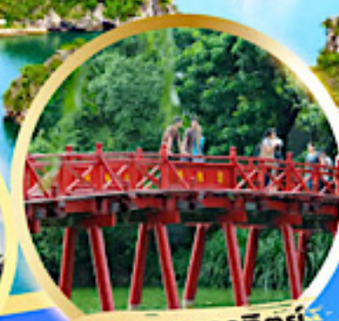
สะพานแสงอาทิตย์