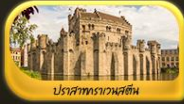
ปราสาทราเวนสตีน