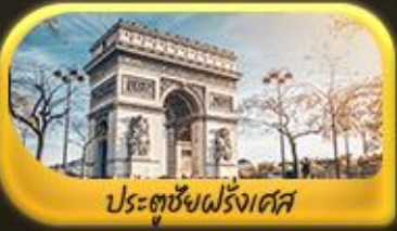
ประตูชัยฝรั่งเศส

พิเศษ!! ล่องเรือแม่น้ำแซนชมเมือง โดย บาโด บูช