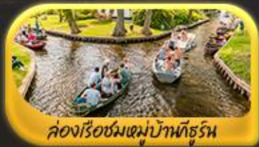
ล่องเรือชมหมู่บ้านชัวร์ิน