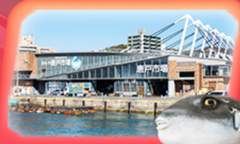
KARATO FISH MARKET