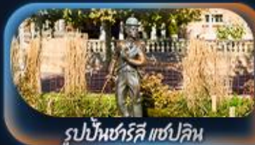
รูปปั้นชาร์ลี แชปลิน

โบสถ์ฟรอมุนสเตอร์ ซ็อบป์นิงจุงเกนบนบานไอฟพตราเซอร์