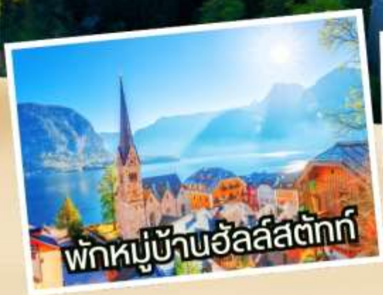
พักผ่อนบ้านอัลส์ตัทท์