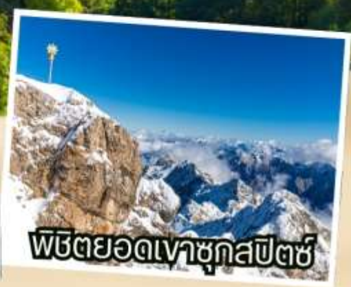
พีชียอดเทาชุกสปีตซ์