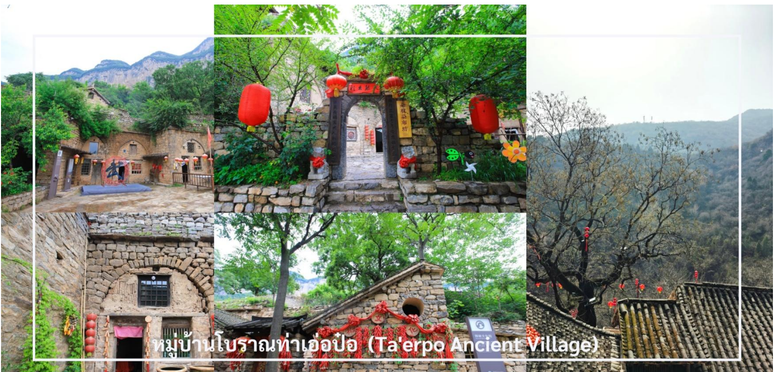
หมู่บ้านโบราณท่าเอ๋อเป้อ (Ta'erpo Ancient Village)

อิสระให้ท่านเดินชมถนนหินภายในหมู่บ้าน ชมบ้านเก่าแก่ที่ยังคงเอกลักษณ์แบบดั้งเดิม แวะถ่ายภาพตามมุมต่าง ๆ และลองชิมขนมพื้นเมืองที่ทำสดใหม่ เช่น เต้าฮู้ร้อน ๆ รวมถึงแวะถ่ายรูปกับประติมากรรมโบราณ ซึ่งเป็นอีกหนึ่งมุมสวยของหมู่บ้านแห่งนี้