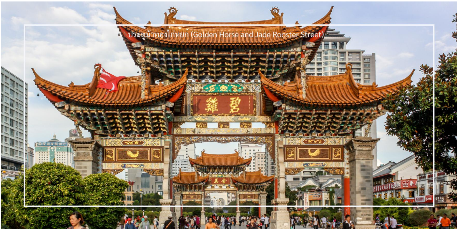
ประตูม้าทองไก่หยก (Golden Horse and Jade Rooster Street)

อิสระช้อปปิ้งถนนคนเดิน ประตูม้าทองไก่หยก (Golden Horse and Jade Rooster Street) เป็นแหล่งช้อปปิ้งที่มีชื่อเสียงในเมืองคุนหมิง (Kunming) สถานที่นี้เป็นที่นิยมของนักท่องเที่ยวและชาวเมืองสำหรับการช้อปปิ้ง สัมผัสวัฒนธรรมท้องถิ่น และลิ้มลองอาหารอร่อย ถนนคนเดินนี้มีร้านค้าหลายประเภท เช่น เสื้อผ้า ของที่ระลึก งานศิลปะ และของกินท้องถิ่น นักท่องเที่ยวสามารถเลือกซื้อสินค้าต่างๆ ได้ตามใจชอบ ถนนคนเดินนี้เต็มไปด้วยชีวิตชีวา มีการแสดงสด ดนตรี และกิจกรรมต่างๆ ที่ทำให้บรรยากาศน่าสนใจและน่าตื่นเต้น และยังมีร้าน POP MART ให้เหล่าสาวก ART TOY ให้เลือกซื้อคอลเลกชันแปลกใหม่ ที่อาจจะหาซื้อไม่ได้ในเมืองไทย