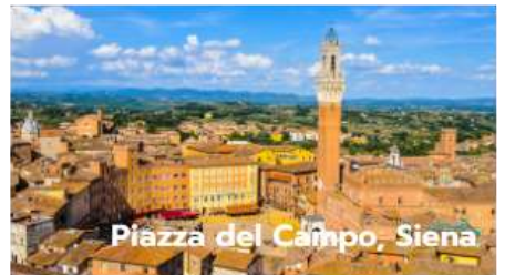
Piazza del Campo, Siena