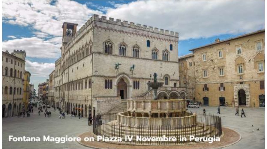
Fontana Maggiore on Piazza IV Novembre in Perugia