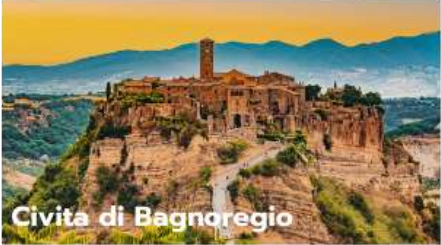
Civita di Bagnoregio