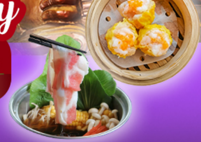
วัดเชกทงมิว