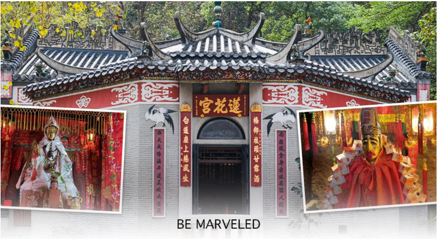
BE MARVELED วัดหลินฟ้า