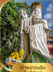
เจ้าแม่กวนอิม ริวสิ่วชี่