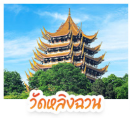
วัดเลิ่งฉวน