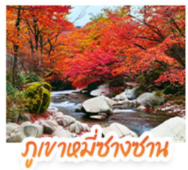
ภูเขาเม้งชางซาน