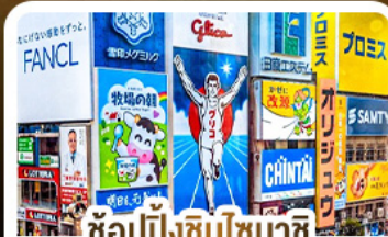
ซ้อปั้งชินโซบาชิ และโดตงโมริ