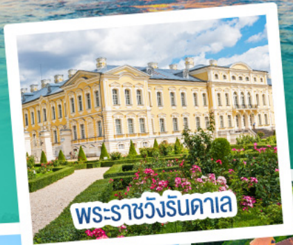
พระราชวังรินดาลา