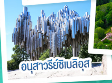
อนุสาวรีย์ซีเบลิอุส