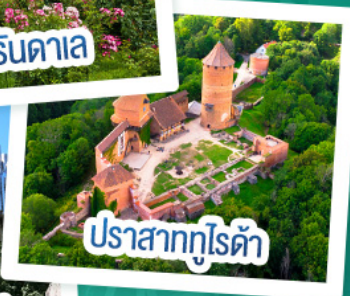
ปราสาทกูไรต้า