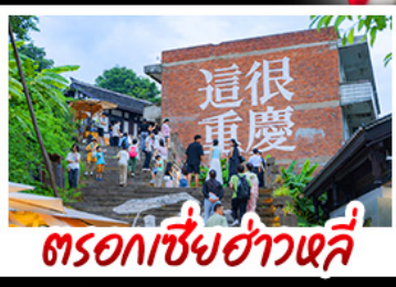
ตรอกซี้ซ่าวหลี่