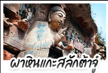
พาเดินแกะสลักต้าจู้