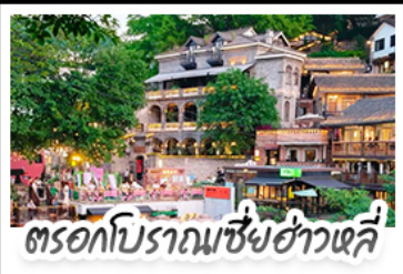
ตรอกโบราณเขี้ยวฮั่วหลี่