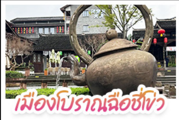
เมืองโบราณฉือชี่เซว