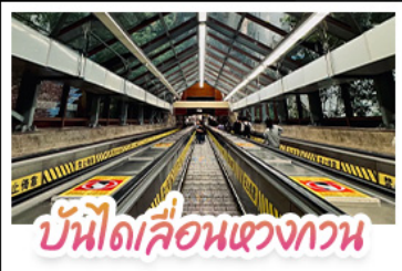
บันไดเลื่อนแขวงทวน