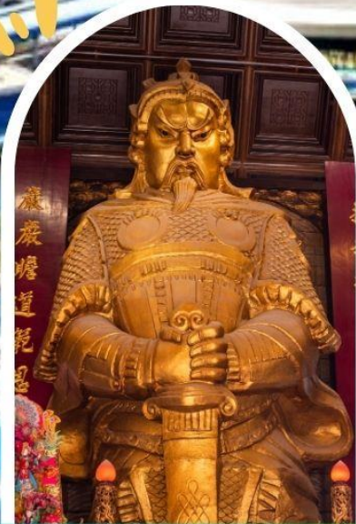
วัดแซก ขอพรโชคลาก การเงิน และธุรกิจ