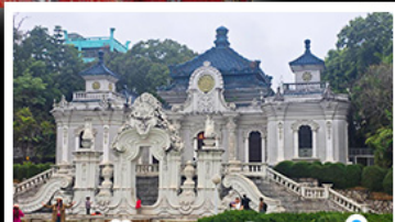
พระราชวังหยวนเหมิงหยวน