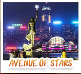
AVENUE OF STARS