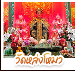
วัดเล่งโง้ว

นั่งรถรางฟ้าดีแถมสู่ TOP OF PEAK • ซ้อมปังจุใจมกติก และ CITYGATE OUTLAETS • นั่งกระเช้ามองปิง สักการะพระใหญ่เทียนถาน • จอพรเจ้าแม่หล่งโหมว แม่ทอง 5 มังกร ให้ประสบความสำเร็จในทุกๆ ด้าน