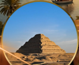
พีระมิดขั้นบันได