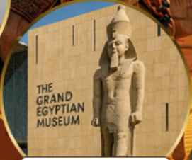
พีพีรภัณฑ์แกรนด์อียิปต์