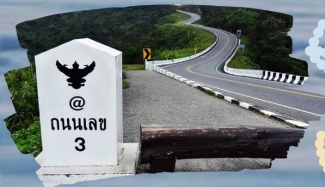
ถนนหมายเลข 3