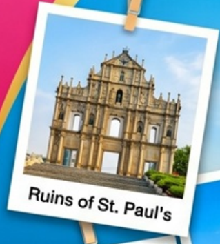
Ruins of St. Paul's