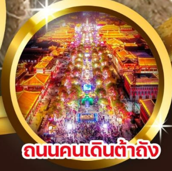
ถนนคนเดินต้าถิง