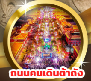
ถนนคนเดินต้าถัง