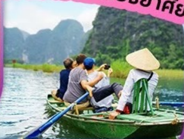
นั่งเรือกระจาด