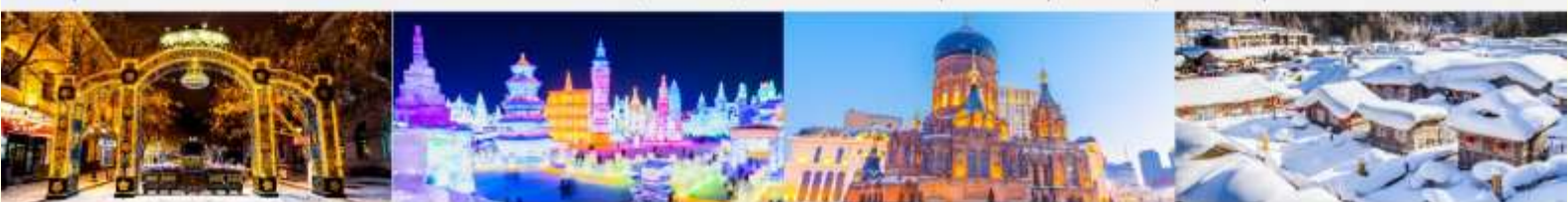
ถนนคนเดินจงหยาง เทศกาลคอมไฟน้ำแข็ง โบสถ์เซนต์โซเฟีย หมู่บ้านหิมะ

*ทางบริษัทฯ ขอสงวนสิทธิ์ในการสลับโปรแกรมทัวร์ตามความเหมาะสมขึ้นอยู่กับสถานการณ์หน้างาน โดยคำนึงถึงผลประโยชน์ของลูกค้าเป็นสำคัญ