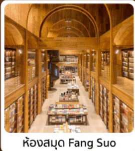
ห้องสมุด Fang Suo