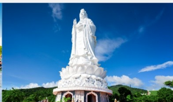
วัดลินห์อิ่ง