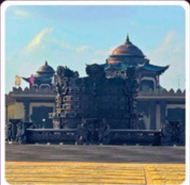
ศูนย์วัฒนธรรมหยวนหยิว