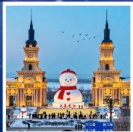
ตึกตาสหิมะยักษ์