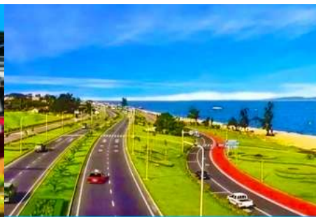
ถนนหวนเต่าลู่