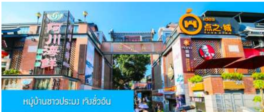
หมู่บ้านชาวประมง เจิงซัวอัน