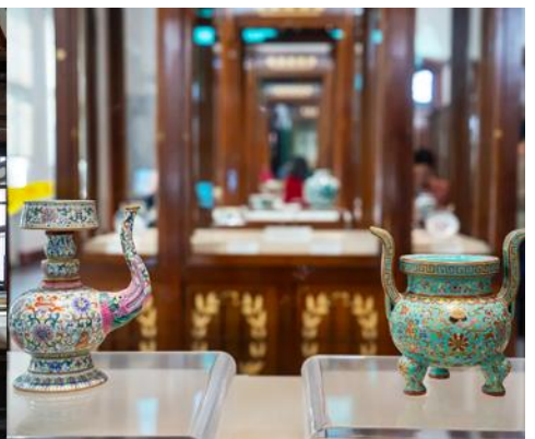
พิพิธภัณฑสถานประวัติศาสตร์หลี่ซุ่น

จากนั้นนำท่านเที่ยวชมและเก็บภาพ ณ พิพิธภัณฑสถานประวัติศาสตร์หลี่ซุ่น 旅顺博物馆 เป็นอาคารพิพิธภัณฑ เก่าแก่อายุกว่าร้อยปีแห่งแรกที่สร้างขึ้นทางภาคตะวันออกเฉียงเหนือของจีน อาคารพิพิธภัณฑที่มีความโดดเด่น ด้วยสถาปัตยกรรมแบบกรีกโรมันยุคเรเนซองส์ ผสมผสานสถาปัตยกรรมแบบตะวันตก ภายในมีการจัดแสดง โบราณวัตถุกว่า 60,000 ชิ้น ท่านสามารถเก็บภาพที่ระลึกด้านหน้าอาคารพิพิธภัณฑ และสามารถเข้าชม โบราณวัตถุภายในพิพิธภัณฑได้ตามอรรถาสัย (พิพิธภัณฑที่ปิดทุกวันจันทร์)..